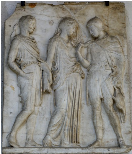
Orphée et Eurydice sur un bas-relief du I er siècle et vus par Auguste Rodin à la fin du XIX e siècle

Cette réflexion prend notamment la forme de portfolios (cela consiste à mettre en parallèle une œuvre d'art ou un texte antique avec une œuvre ou un texte moderne ou contemporain) : cette année, les élèves de 2 nde ont ainsi réalisé un portfolio sur les métamorphoses célèbres de la mythologie gréco-romaine et ceux de 1 ère , un portfolio sur les couples mythologiques, pour montrer que les mythes pouvaient être interprétés de manières parfois très différentes selon les époques.