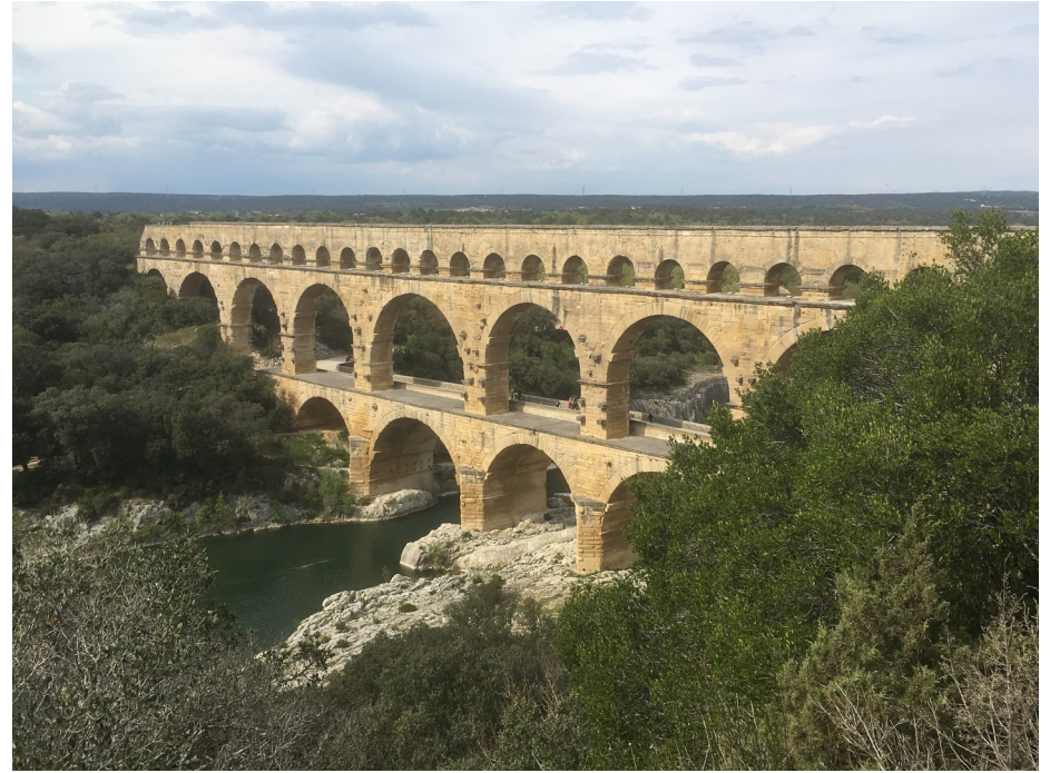
le Pont du Gard

L'année dernière, nous avons ainsi découvert la Provence romaine (le pont du Gard, le théâtre d'Orange, les villes de Glanum et de Vaison-la-Romaine ou encore les arènes d'Arles) ; cette année, un voyage à Rome prévu fin avril aura finalement lieu au printemps prochain.